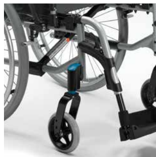
Fourches en Aluminium avec têtes de fourches extérieures. Pour plus de sécurité et de rigidité.