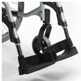
Potences 80° escamotables intérieur / extérieur, pour faciliter les transferts.

Avec un nouveau design bicolore allié à la robustesse de la conception de l' Action 3 NG , l' Action 2 NG ne vous décevra pas. Il vous suivra partout !